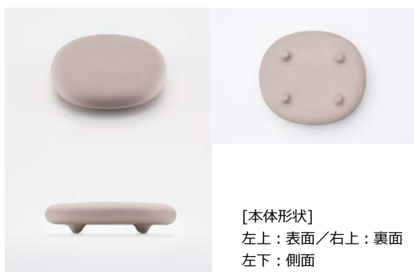
[本体形状] 左上：表面／右上：裏面 左下：側面