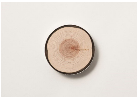
ディフューザー本体